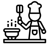
Taller de cocina