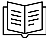
Lectoescritura en Inglés